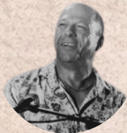
Direction musicale et co-composition Fabien Tessier