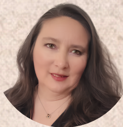
Mise en scène : Nadine Micoud