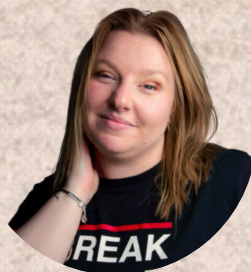
Chorégraphies : Léa Antoine